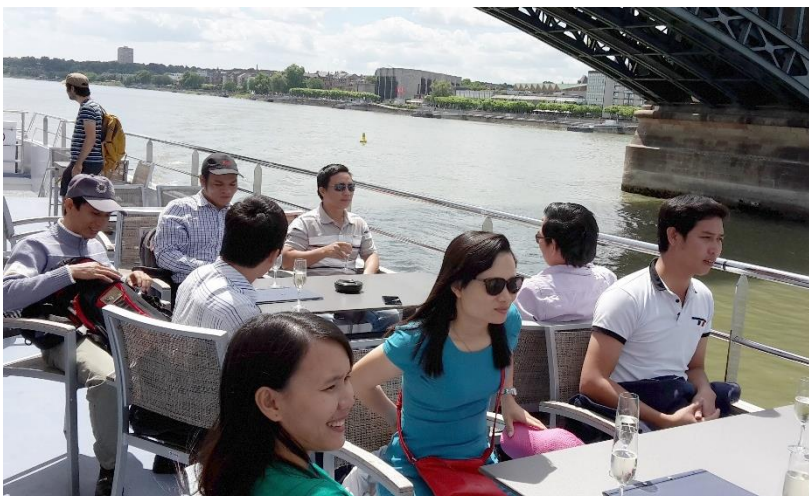
Bootstour auf dem Rhein

Ein weiteres Highlight war der Besuch von Rudesheim mit einer Schiffstour auf dem Rhein. Da man im Rahmen einer Fachexkursion die Messe Intersolar in München besuchte, fehlte auch dort nicht der touristische Aspekt.