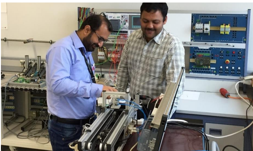
Automatisierungstechnik unter dem Vorzeichen Industrie 4.0