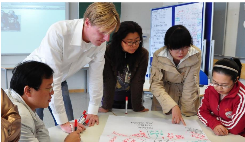
Diskussion über handlungsorientierten Unterricht