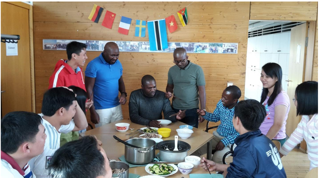
Vietnamesische und südafrikanische Gäste beim gemeinsamen Essen