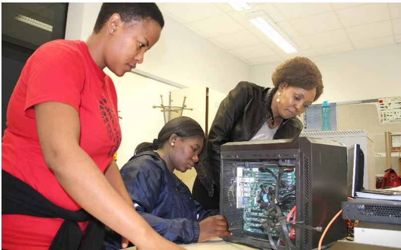
Montage und Administration eines Servers

Durch die Verbindung unserer informationstechnischen und pädagogischen Module ergibt sich für den Auftraggeber die Möglichkeit, die Teilnehmer(innen) nach dem Training unter administrativen Aspekten als IT-Spezialisten einzusetzen oder im pädagogischen Bereich als Lehrkräfte bzw. Ausbilder(innen). Da gerade an Schulen die Administration der IT durch Lehrkräfte durchgeführt wird, ist unser Training ideal für diese Zielgruppe bzw. Bildungseinrichtung.