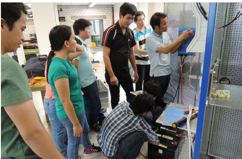
Konfiguration eines Batteriesystems zur Eigenverbrauchsanhebung

Bei diesem Projekt wurde eine Photovoltaikanlage geplant und in Betrieb genommen. Für Analyse, Planung und Kalkulation wurden typische Berechnungsmodelle und Softwarewerkzeuge eingesetzt. Die Zusammenarbeit der Teilnehmenden sowie der gegenseitige Ideen- und Informationsaustausch wurde angestrebt.