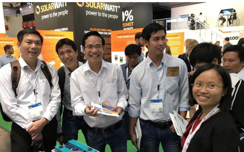
Besuch der Intersolar